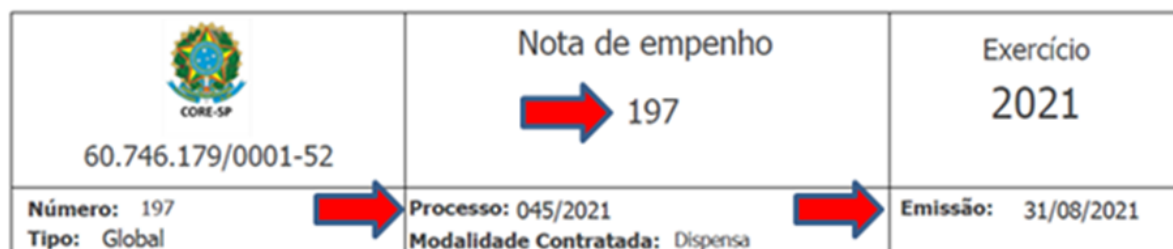
Figura 1: Exemplo de cabeçalho da Nota de empenho com as informações para a contratada informar na nota fiscal.

7.25.2. Na Nota Fiscal deverá obrigatoriamente constar no campo um (1) o número da nota de empenho, no campo dois (2) o número do processo, e ainda se o (3) "Documento foi emitido por ME ou EPP Optante Simples Nacional ou não", acompanhado do respectivo comprovante.